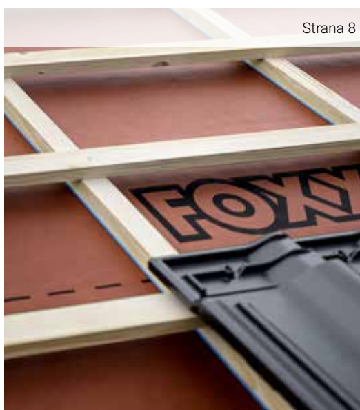
DELTA®-FOXX PLUS / DELTA®-FOXX