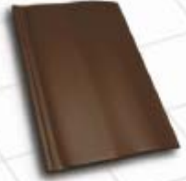
■ 8993 – torfbraun