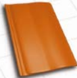
■ 3990 – rot