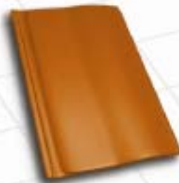
■ 3991 – ziegelrot