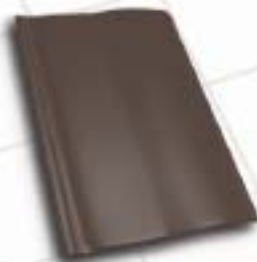
■ 9990 – anthrazit