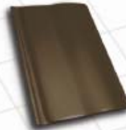
■ 8991 – dunkelbraun