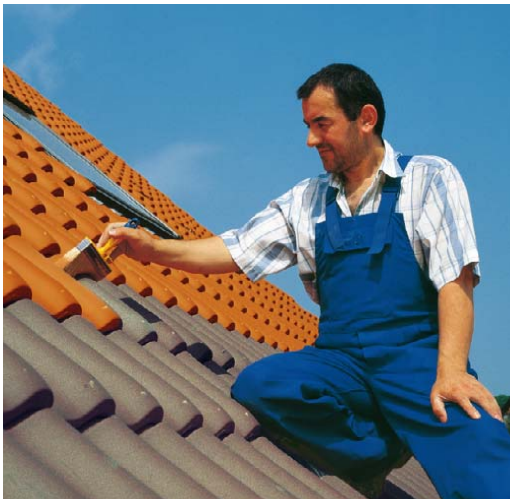
DELTA®-ROOFCOAT erneuert verwitterte Dachflächen durch eine wetterbeständige Beschichtung.