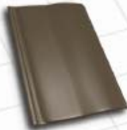
■ 7991 – schiefergrau