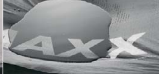
Zusätzliche Sicherheit durch DELTA®-System-Komponenten.