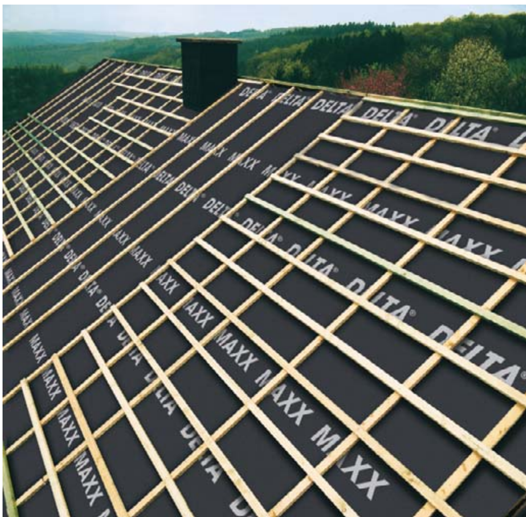
DELTA®-MAXX ist Deutschlands beliebteste Unterdeckbahn für Steildächer.